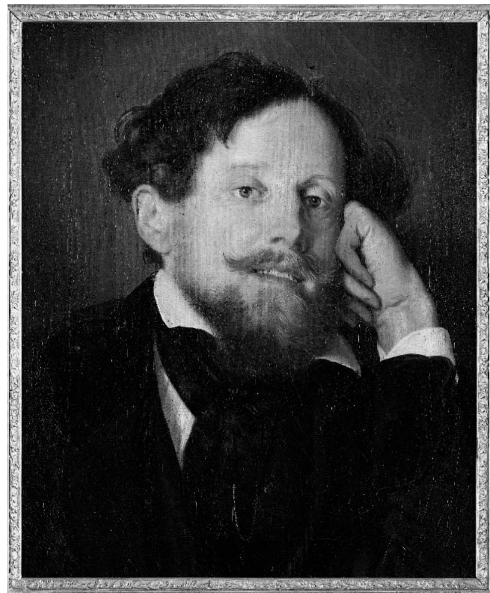
G. Bezzuoli, Ritratto di Niccolò Puccini , ASIRPT, XXI, 2, 22.